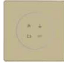
● 香槟色边框+香槟色玻璃